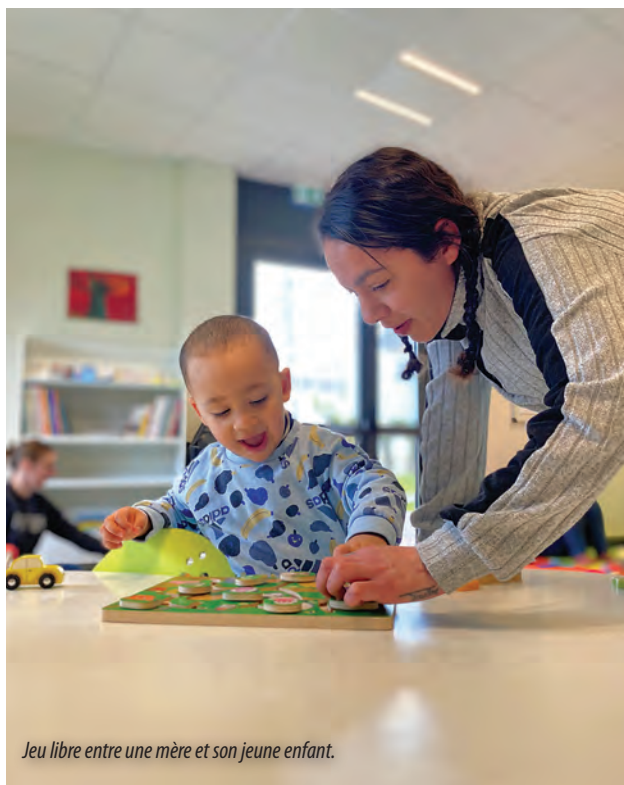
Jeu libre entre une mère et son jeune enfant.

LAEP du Centre social St-Exupéry 2 av du Maréchal De-Lattre-de-Tassigny 05.53.45.60.30 / 07.83.20.39.92 csc24.dilosquer@gmail.com