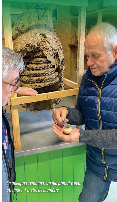
En quelques semaines, un nid primaire peut atteindre 1 mètre de diamètre.