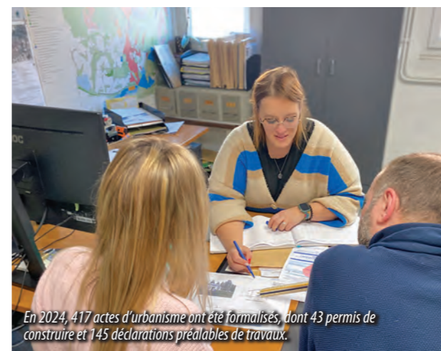
En 2024, 417 actes d'urbanisme ont été formalisés, dont 43 permis de construire et 145 déclarations préalables de travaux.

Outre la programmation des travaux menés sur le terrain par les équipes des ateliers, le pôle administratif des services Techniques assure un rôle central pour le bon fonctionnement de la Ville et dans l'accompagnement des grands projets.