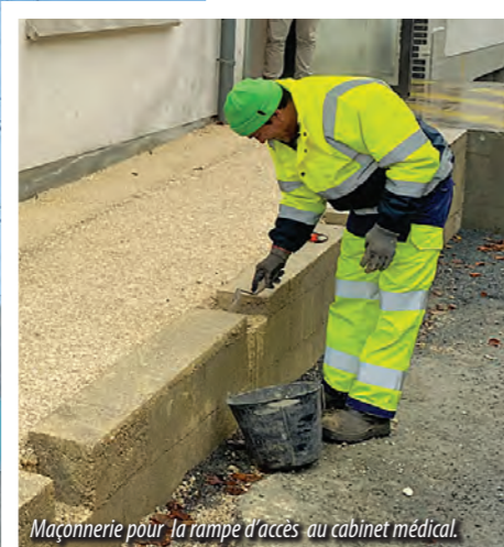
Maçonnerie pour la rampe d'accès au cabinet médical.