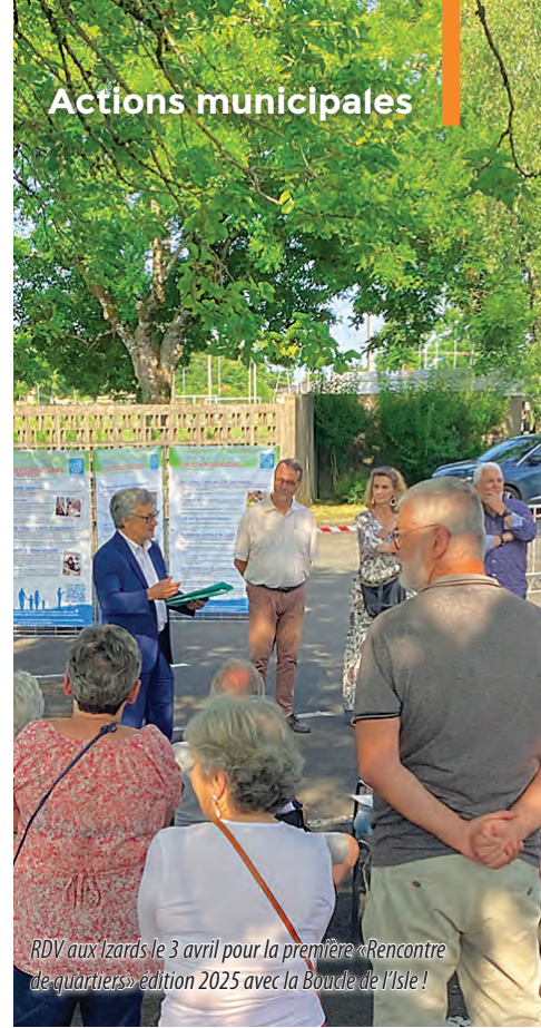
RDV aux Izards le 3 avril pour la première «Rencontre de quartiers» édition 2025 avec la Boucle de l'Isle !

📅 Détails du calendrier des rencontres au dos du journal et sur www.coulounieix-chamiers.fr