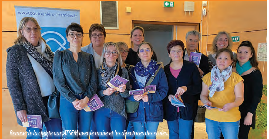
Remise de la charte aux ATSEM avec le maire et les directrices des écoles.

Les 10 Agents Territoriaux Spécialisés dans les Écoles Maternelles ont désormais leur charte. Fruit d'un travail collaboratif entre les Atsem, la Ville et l'Éducation nationale, la charte des ATSEM a été officiellement remise le 11 février. Conçue avec et pour les agents, elle clarifie leurs missions et celles des enseignants en fonction des temps de la journée des enfants. Ce document, issu d'échanges approfondis entre tous les acteurs de la vie des écoliers, valorise leur rôle essentiel dans les écoles maternelles. Inscrite dans le Projet éducatif de la Ville, cette charte garantit une meilleure cohérence des pratiques pour accompagner les 200 jeunes enfants scolarisés dans les 9 classes de maternelle des deux écoles de la Ville !