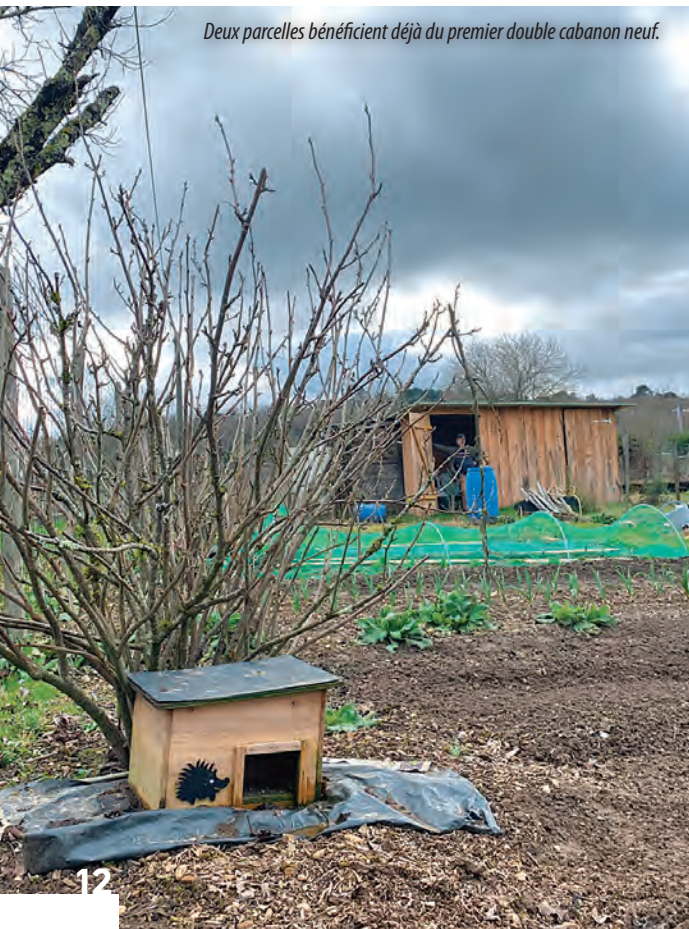
Deux parcelles bénéficient déjà du premier double cabanon neuf.